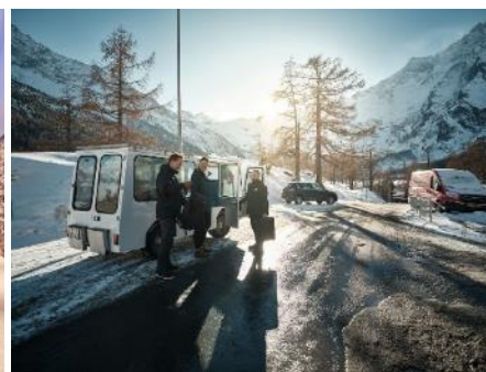
Walliserhof Grand-Hotel & Spa Saas-Fee